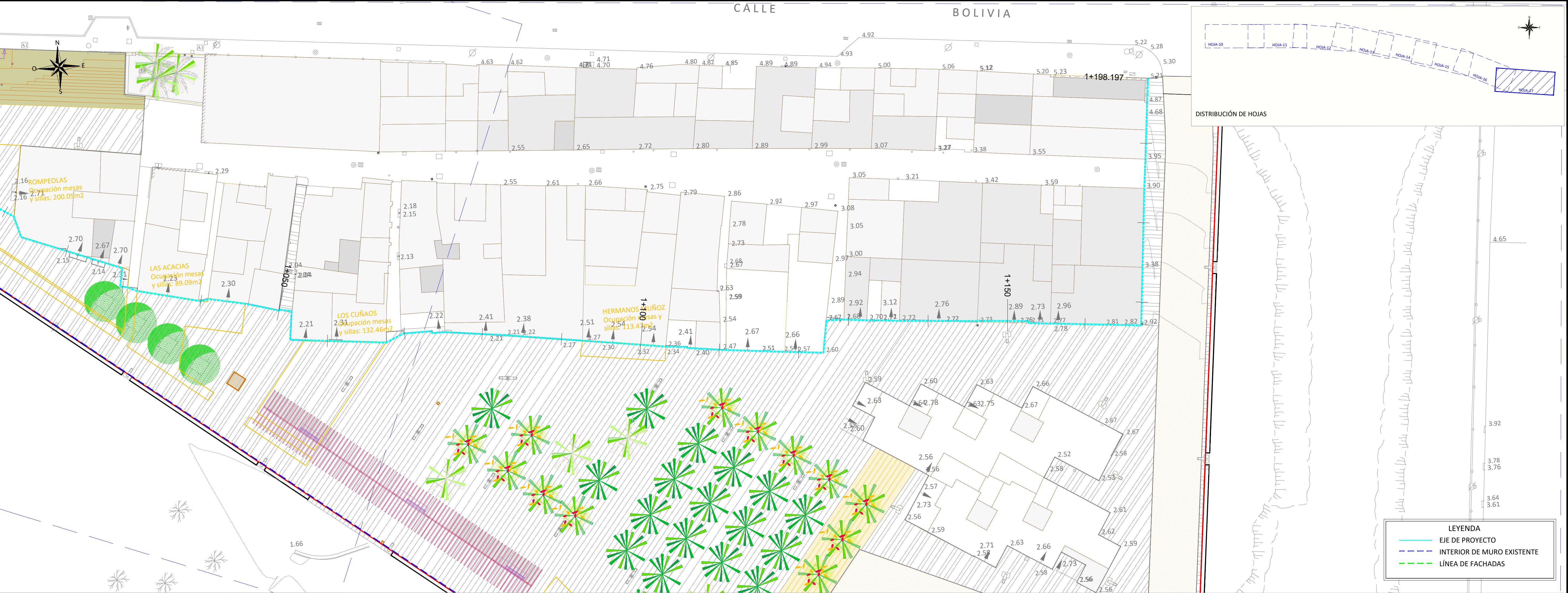
DISTRIBUCIÓN DE HOJAS